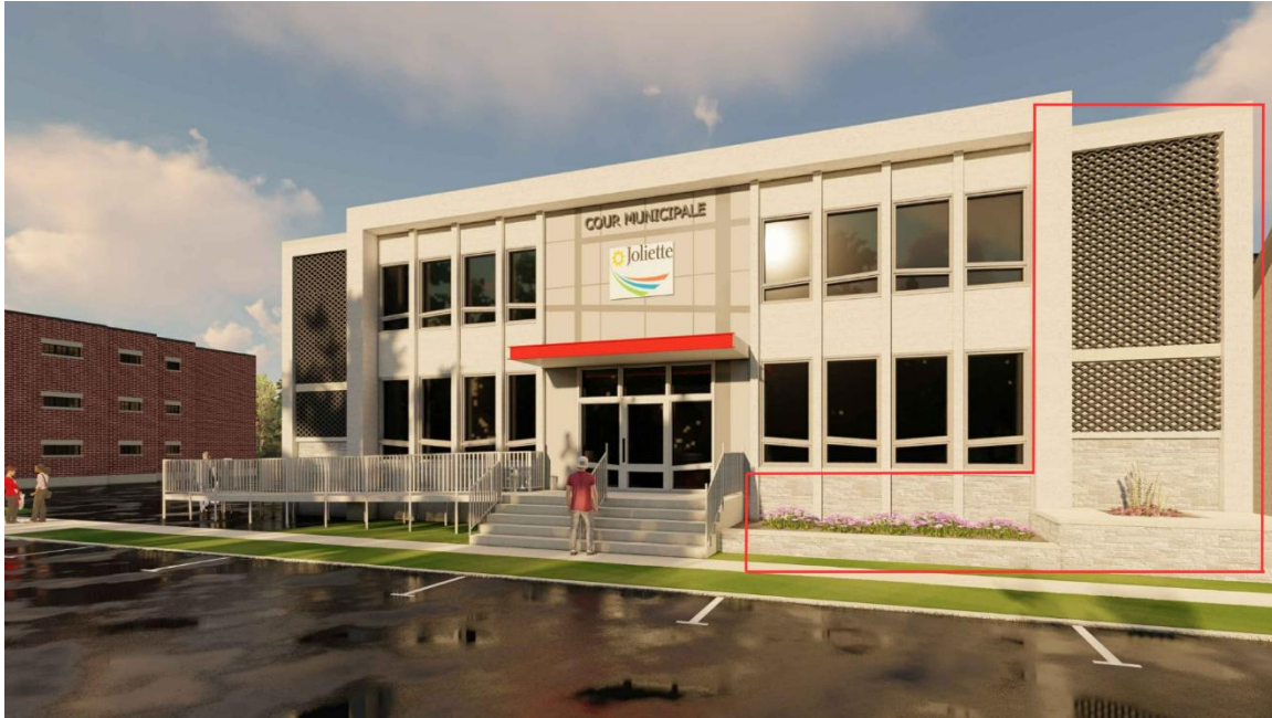
Dimensions en façade