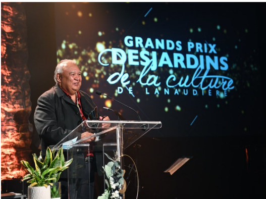
Communauté de Manawan —2021