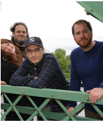
Les Cowboys fringants—2017