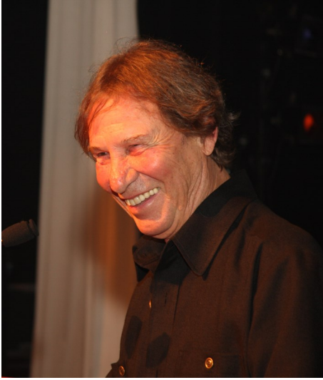
Jean-Pierre Ferland—2008, Crédit photo: Jean Chevrette