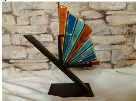
Trophée des bâtisseurs

Créée par Guylaine Desrochers, artisane vitrailliste, l'œuvre représente un arc-en-ciel en gage de la beauté naturelle de la jonction entre la pluie et le soleil. Cette œuvre est un verre fusionné avec assemblage de cuivre et de plomb sur une base de métal. À ce jour, la Ville de Terrebonne, de Repentigny, de Notre-Dame-des-Prairies ainsi que la communauté Atikamek de Manawan sont entrées au Temple de la renommée au titre de bâtisseur. S'y ajoute maintenant Jean-Pierre Corneault.