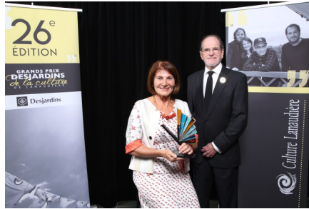
Ville de Repentigny —2017