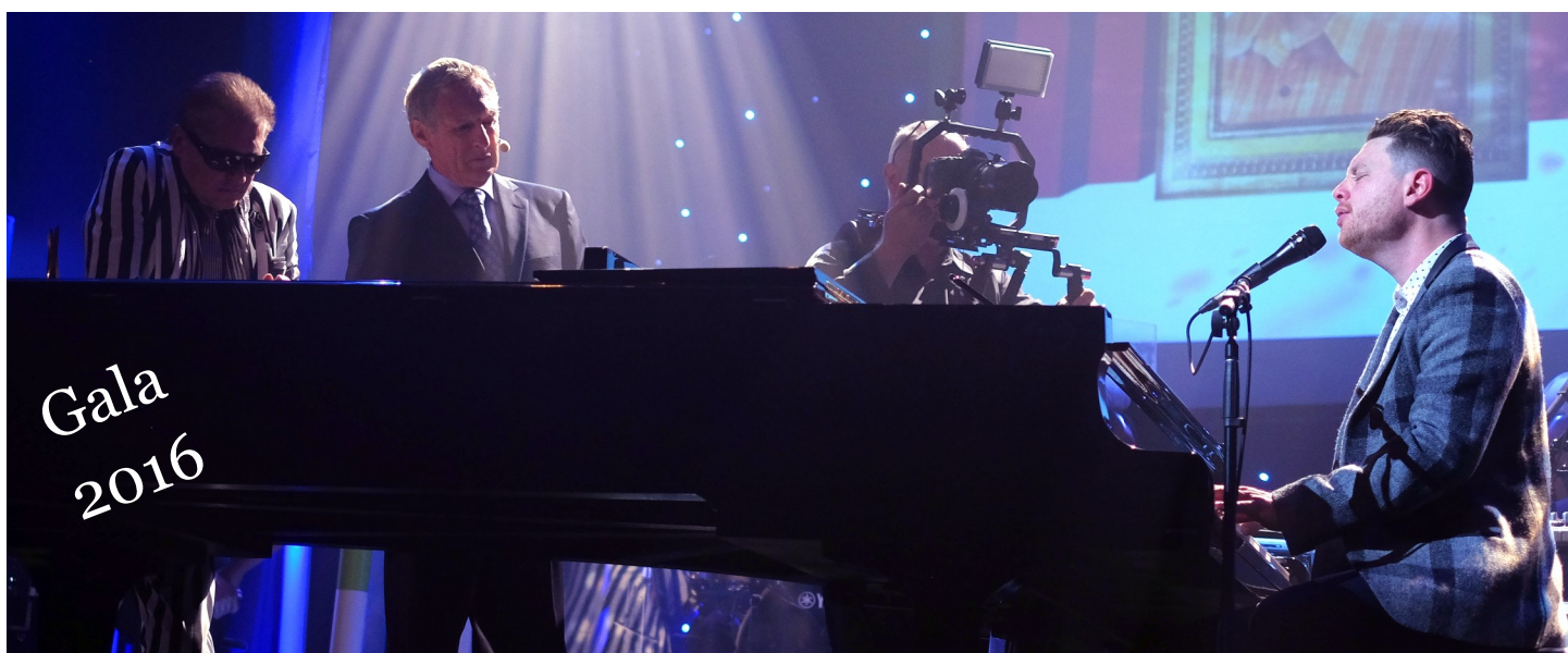
Performance Yann Perreau — Gala 2016