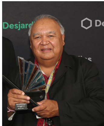
Communauté Atikamek Manawan—2021