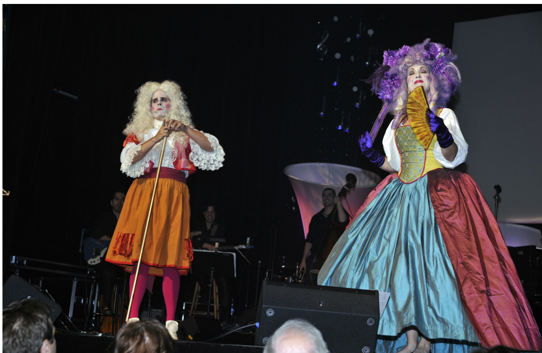
Performance du Théâtre Advienne que pourra — Gala 2011 — 20e anniversaire des Grands Prix Desjardins de la culture