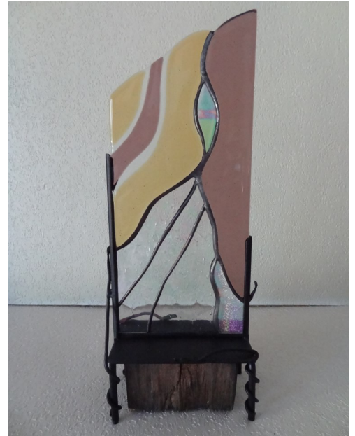
Œuvre «Le Charlotte»

Déjà au seuil de sa carrière qui a pris son envol avec la Bottine souriante dans les années 70, Yves Lambert plongeait dans ses racines lanauchoises pour s'inspirer, pour fêter et pour s'exprimer. Ce fut le premier pas d'une mise à jour intarissable de l'univers de la musique traditionnelle. À un moment dans l'histoire du Québec, où la jeune génération était tournée vers un futur des plus contemporains et engagés, Yves Lambert faisait rejaillir la musique traditionnelle, entraînant dans sa suite des musiciens charmés mais aussi des fans qui devinrent irréductibles et dont le nombre amplifiait d'année en année.