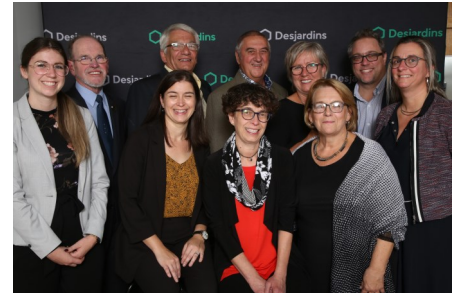
Ville de Notre-Dame-des-Prairies —2017