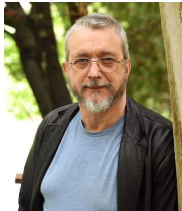
Dan Bigras—2022