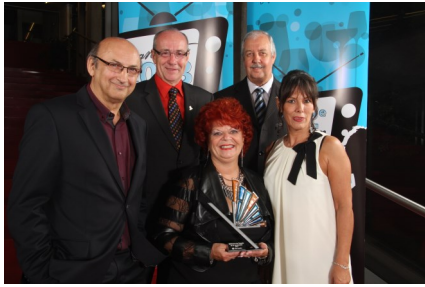
Ville de Terrebonne —2013