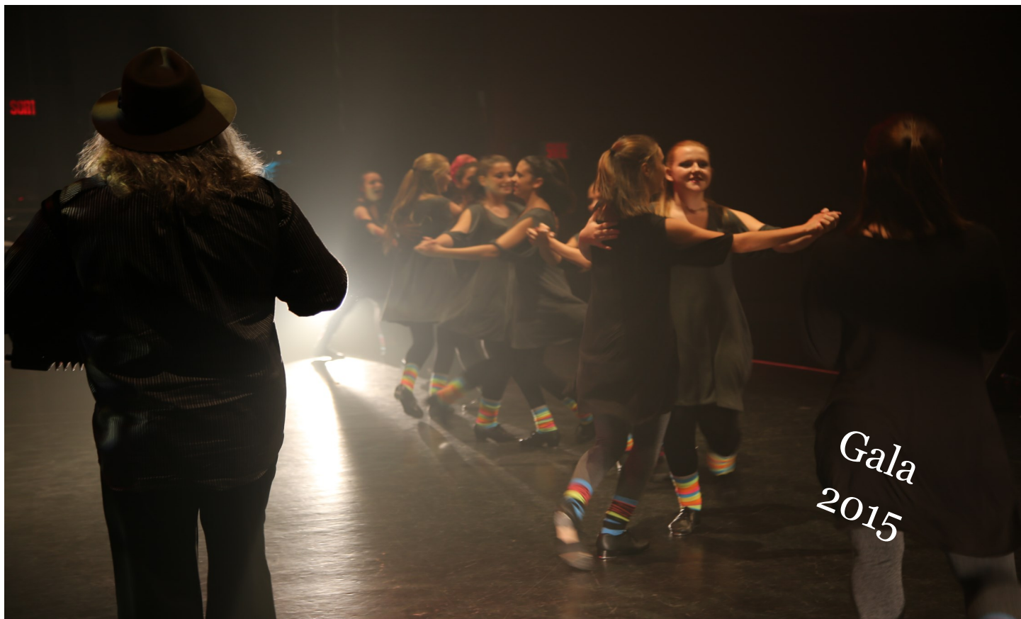
Performance La Foulée — Répétition Gala 2015