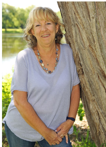
Louise Tremblay D'Essiambre—2018, Crédit photo: Christian Rouleau