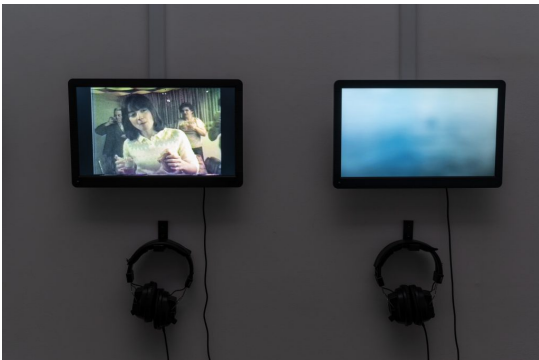
PHOTO DE L'EXPOSITION FIRST FIFTH

First Fifth, une installation vidéo à quinze canaux, raconte l'histoire de la vie humaine à travers des vidéos maison, du found footage et des films abstraits. L'expérience collective qu'est celle de vivre, le rêve et l'imagination sont certains des thèmes qui émergent dans ces images. La série, dans une narration intime et nostalgique, place différents événements des premières années de vie de l'artiste en dialogue avec des moments de l'Histoire.