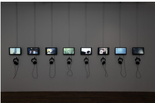
PHOTO DE L'EXPOSITION FIRST FIFTH

First Fifth, une installation vidéo à quinze canaux, raconte l'histoire de la vie humaine à travers des vidéos maison, du found footage et des films abstraits. L'expérience collective qu'est celle de vivre, le rêve et l'imagination sont certains des thèmes qui émergent dans ces images. La série, dans une narration intime et nostalgique, place différents événements des premières années de vie de l'artiste en dialogue avec des moments de l'Histoire.