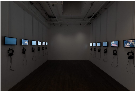
PHOTO DE L'EXPOSITION FIRST FIFTH