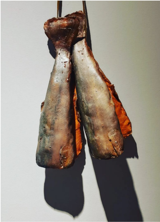
Photo 6 pieds x 4pieds sur aluminium d'une installation de l'œuvre tumulus sur l'île Foresters Ontario.