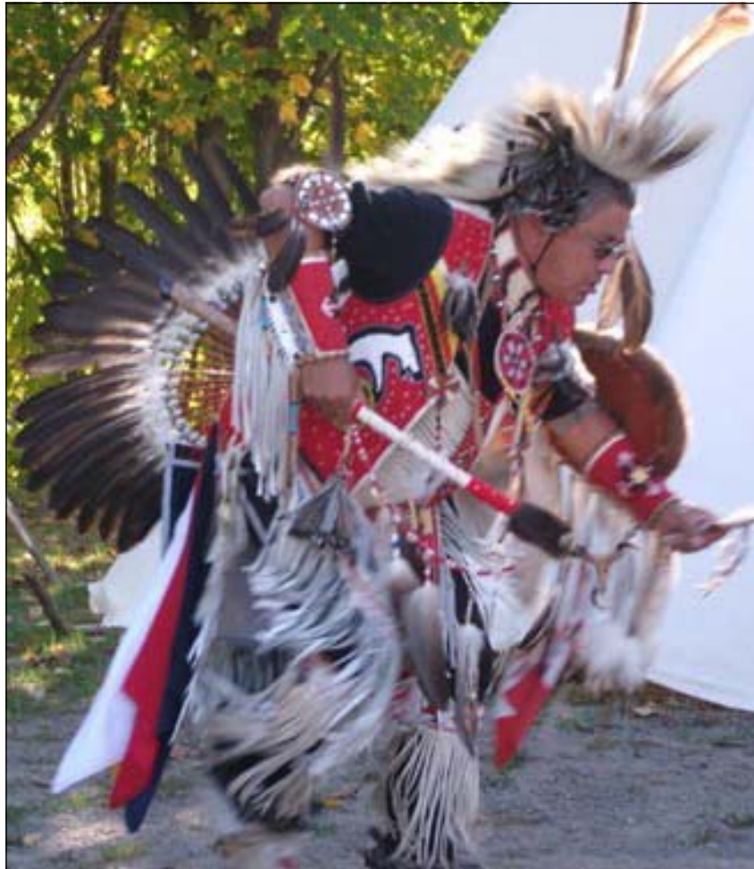
Danseur muni d'un costume des plus colorés orné de plumes d'aigle, de peau d'orignal et de pieds de biche.