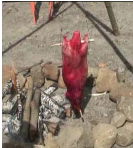
Castor suspendu au dessus du

Plus loin, un homme manifestait ses talents de peintre et d'artisan par l'exposition de tipis et de maquettes miniatures atikamekw ainsi que par des peintures à l'acrylique et à l'huile, inspirées des légendes et traditions de sa culture. Au cœur du plus grand tipi travaillaient trois femmes qui, tout en discutant et en ricanant l'une après l'autre, procédaient à la fabrication de paniers d'écorce de bouleau et de racines de pin gris.