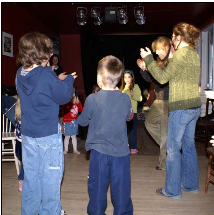
Les animations culturelles applaudies du jeune public au Centre régional d'animation du patrimoine oral (CRAPO) de Lanaudière

Ce que fait aussi à sa manière la maison d'édition jeunesse lanaudoise Éditions du soleil de minuit, qui propose des animations